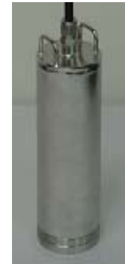
光水位計外観 WL76-1001 (φ76×L200)